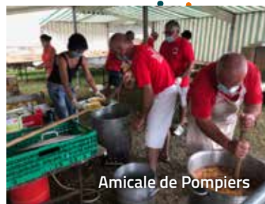
Amicale de Pompiers