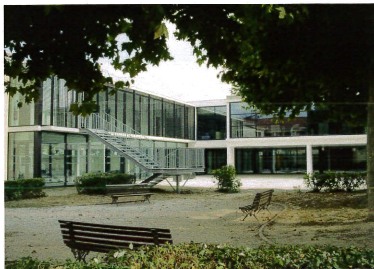
COLLEGE PASTEUR : de magnifiques locaux et un projet pédagogique innovant de Parcours Culturel renforcé

L'ESPACE SOCIO-CULTUREL : le toit est refait depuis cet été de façon à assurer l'étanchéité du bâtiment avant des